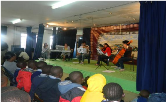
Lo Famiglia Lo Russo esegue il Canone di Pachebel