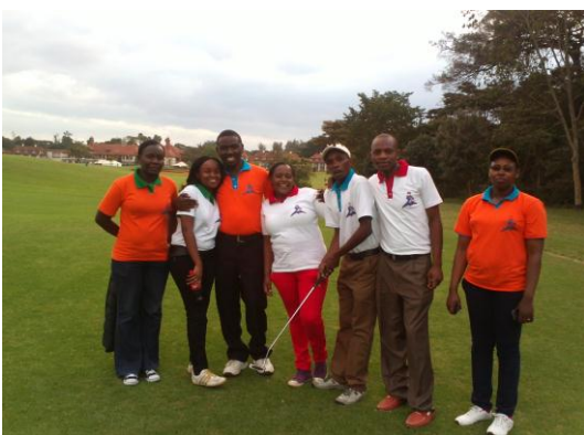
Alcuni insegnanti e bidelli pronti per giocare a golf

Un altro piacevole momento è stato quando a Windsor gli sponsors e gli insegnanti, accompagnati dal tifo degli studenti, hanno partecipato al torneo di golf organizzato per raccogliere fondi. Quest'anno i professori e il personale non docente hanno formato tre squadre. Questo è segno del fatto che in tutti è cresciuta la coscienza che il nostro rapporto non è limitato alla struttura della scuola.